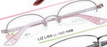
LIZ LISA LL-1022 中国製