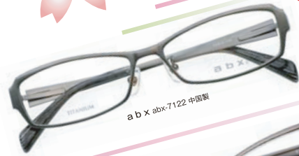
a b x abx-7122 中国製