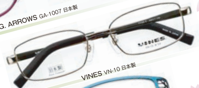
VINES VN-10 日本製