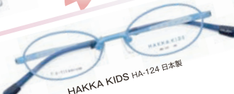
HAKKA KIDS HA-124 日本製