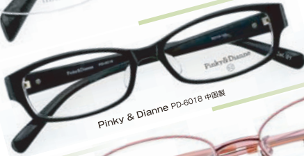
Pinky & Dianne PD-6018 中国製