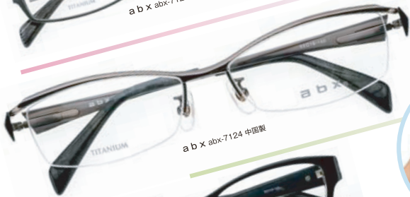
a b x abx-7124 中国製