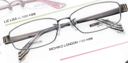
MICHIKO LONDON 1103 中国製

薄型の遠近・中近・近用ワイドと 超薄型単焦点 どのタイプのレンズでも選べる 創業祭メガネセット