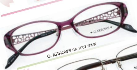
G. ARROWS GA-1007 日本製