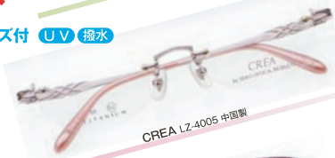
CREA LZ-4005 中国製