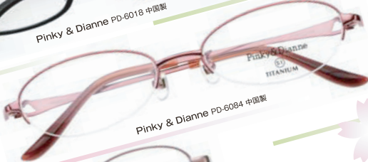
Pinky & Dianne PD-6084 中国製