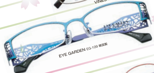
EYE GARDEN EG-109 韓国製