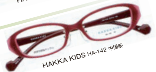
HAKKA KIDS HA-142 中国製