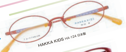
HAKKA KIDS HA-124 日本製